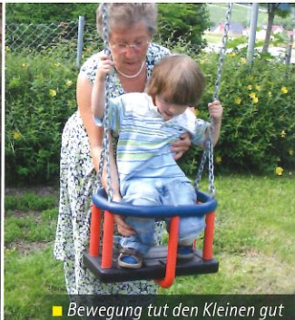
■ Bewegung tut den Kleinen gut