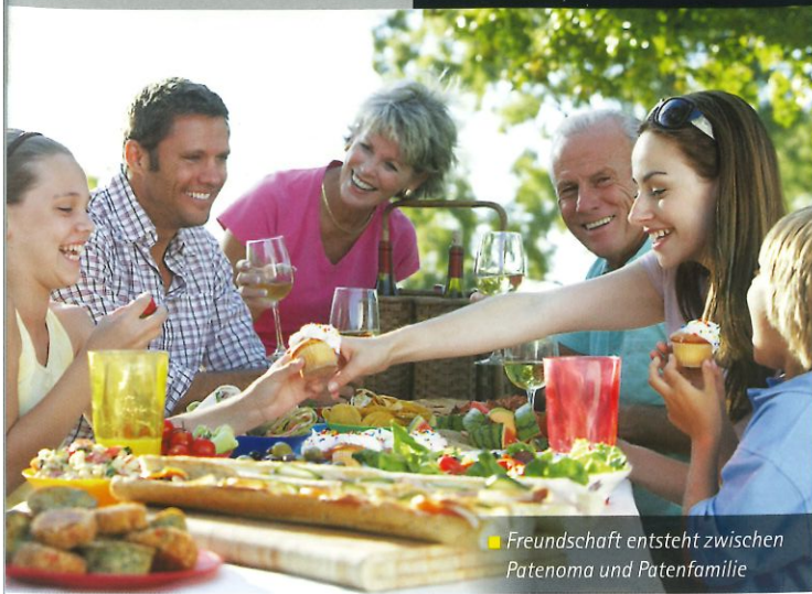
■ Freundschaft entsteht zwischen Patenoma und Patenfamilie