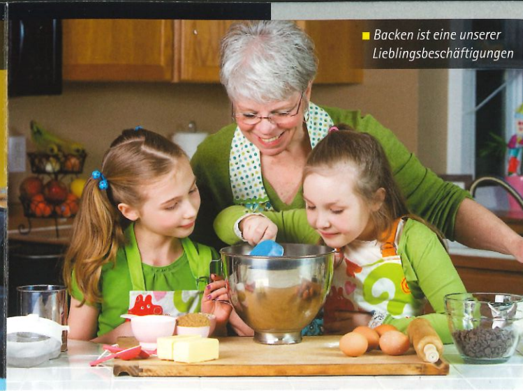
■ Backen ist eine unserer Lieblingsbeschäftigungen