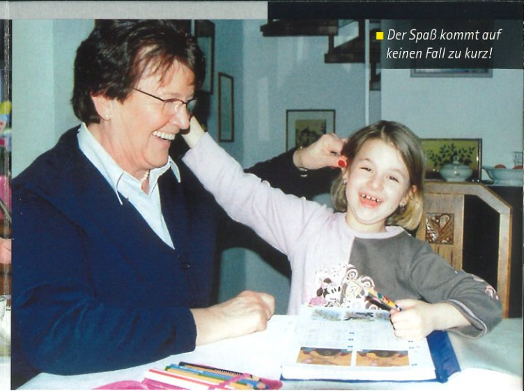
■ Der Spaß kommt auf keinen Fall zu kurz!