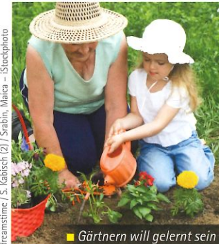
■ Gärtnern will gelernt sein