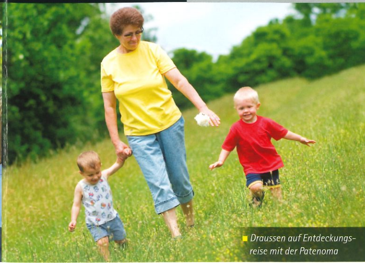
■ Draussen auf Entdeckungsreise mit der Patenoma