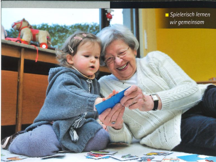
■ Spielerisch lernen wir gemeinsam