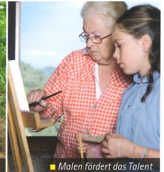
■ Malen fördert das Talent